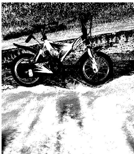
«Gira il mondo dolcemente» di Marco Monticone di Pollein, secondo posto; sopra, «Riflessioni ambientali» di Maurizio Bacci di Cerbaia Val di Pesa (Firenze) fotografia classificata al primo posto

COGNE (fci) Si è concluso giovedì 31 gennaio scorso il quinto concorso fotografico realizzato da Fondation Grand Paradis in occasione della Settimana Europea della Mobilità, nell'ambito del progetto ITER - Imaginez un Transport Efficace et Responsable, per promuovere la mobilità sostenibile e la responsabilità ambientale a favore dei mezzi di trasporto non tradizionali ed ecocompatibili.